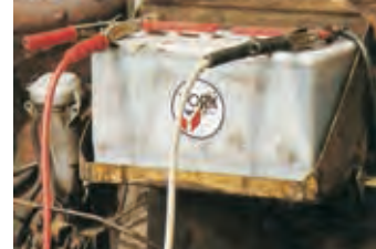
Ricarica batterie Battery charger