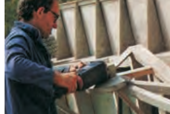
Smerigliatrice elettrica Power-grinder