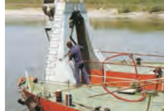
Trapano elettrico Power drill