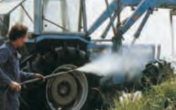
Lavaggio ad alta pressione High pressure washing