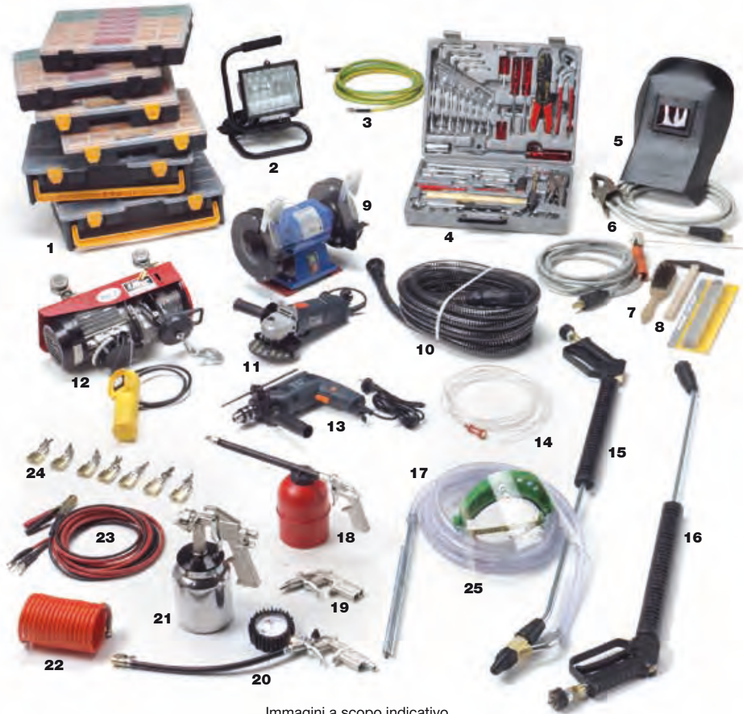
Immagini a scopo indicativo Illustrative purposes only