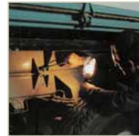
Lampada portatile portable lamp Lámpara