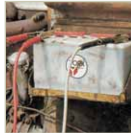
Ricarica batterie Battery charger Carga de baterías