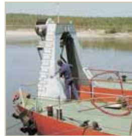
Trapano elettrico Power drill Taladro eléctrico