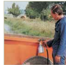
Verniciatura Painting Pintura