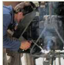
Saldatura Welding Soldadura