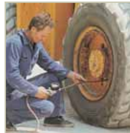
Gonfiaggio pneumatici Tire inflation Inflado de neumáticos