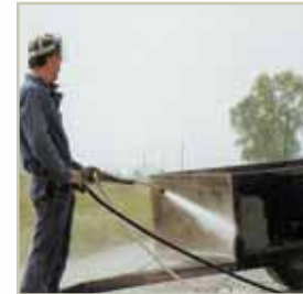
Idrosabbatura Water sand blasting Idroarenadura