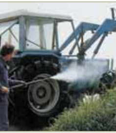
Lavaggio ad alta pressione High pressure washing Lavado de alta presión