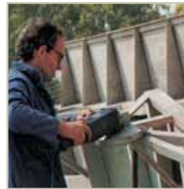
Smerigliatrice elettrica Power-grinder Esmeriladora eléctrica